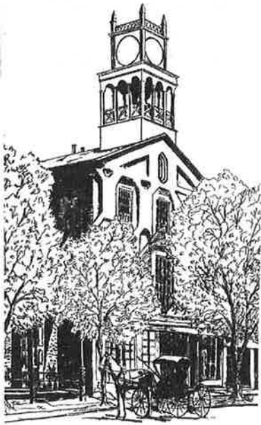
MASSASOIT HALL — CENTER SQUARE

A Strolling Tour of STRASBURG'S HISTORIC DISTRICT